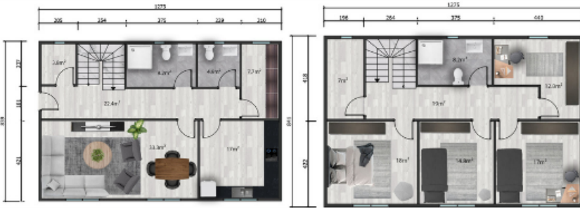
Zemin kat planı/ Ground floor plan