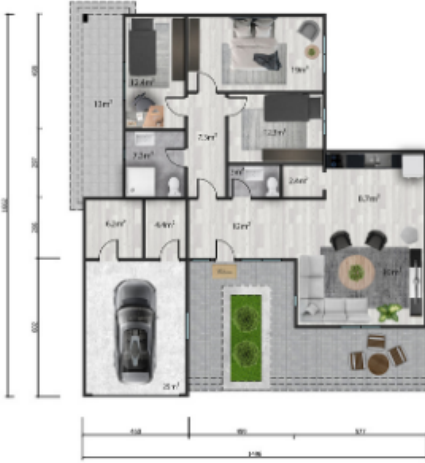
Kat planı / Floor plan