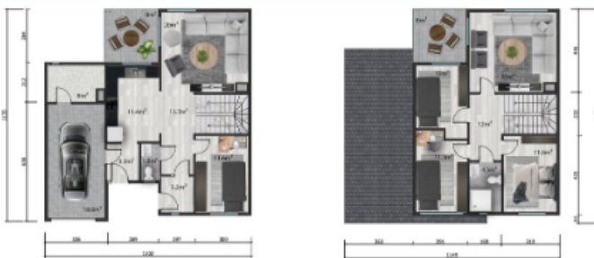
Zemin kat planı/ Ground floor plan