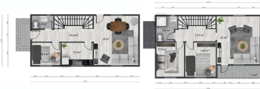
Zemin kat planı/ Ground floor plan