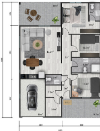
Kat planı / Floor plan