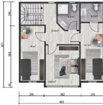
1. kat planı / First floor plan