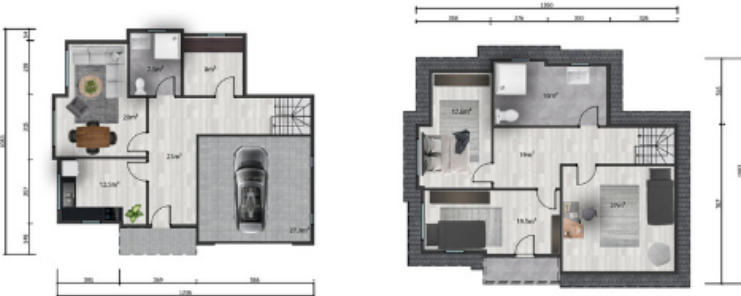
Zemin kat planı/ Ground floor plan