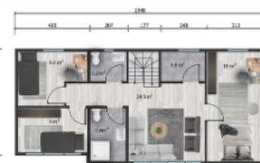
1. kat planı / First floor plan