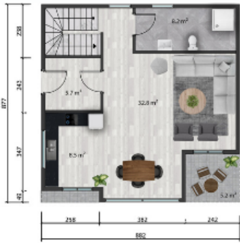
Zemin kat planı/ Ground floor plan